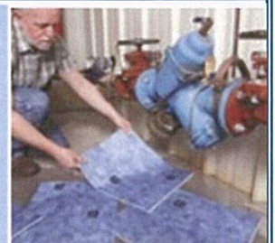
配管からの水漏れ対策