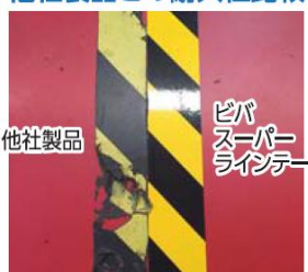
3ヶ月間使用した状態