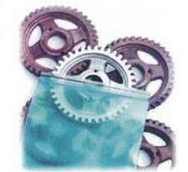
VpCI-1267レーチャック付き袋