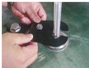
2枚のハサミ連結板で足をはさむ