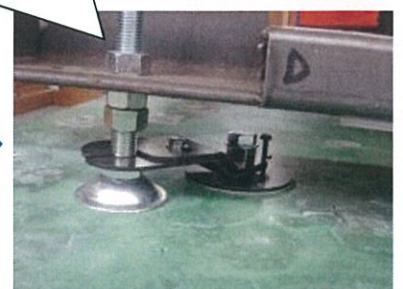
床を傷つけることなく設置完了

取付前に問題なく接着できるかひっぱり強度試験もできますのでお問い合わせください。