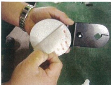
接着パッド付き円盤を床に貼り付ける